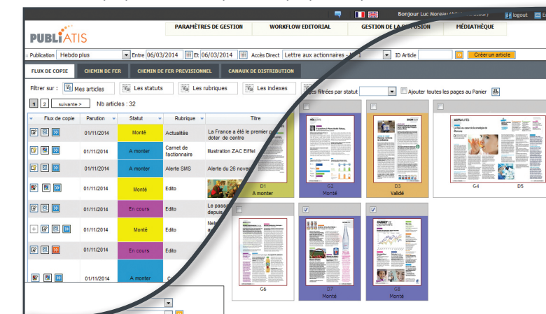
Visualisation du chemin de fer en temps réel ▲